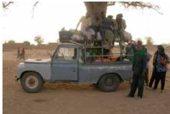
Toyota Land rover