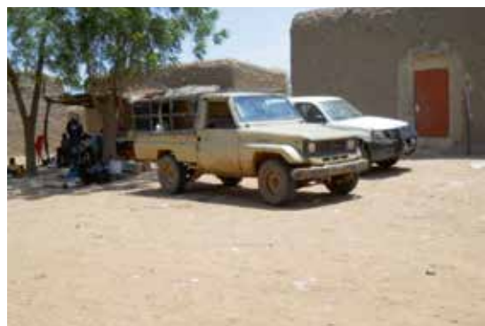
Toyota Land cruiser

national. Ils ne sont généralement affiliés à aucun syndicat du domaine du transport. Contrairement aux autres, les véhicules clandestins assurent exclusivement le transport intérieur, en particulier le trans-