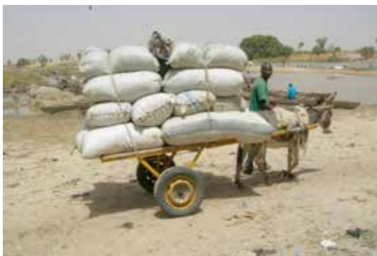
Une charrette asine